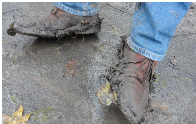
• De modderschoenen van Sjako

Datum: vrijdag 22 januari 2016 van 14.30 C 18.00;