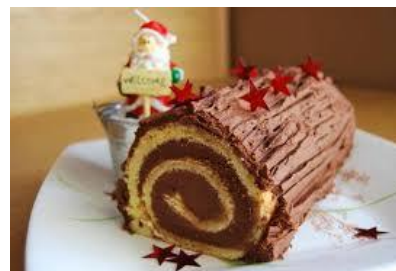
Buche de Noël