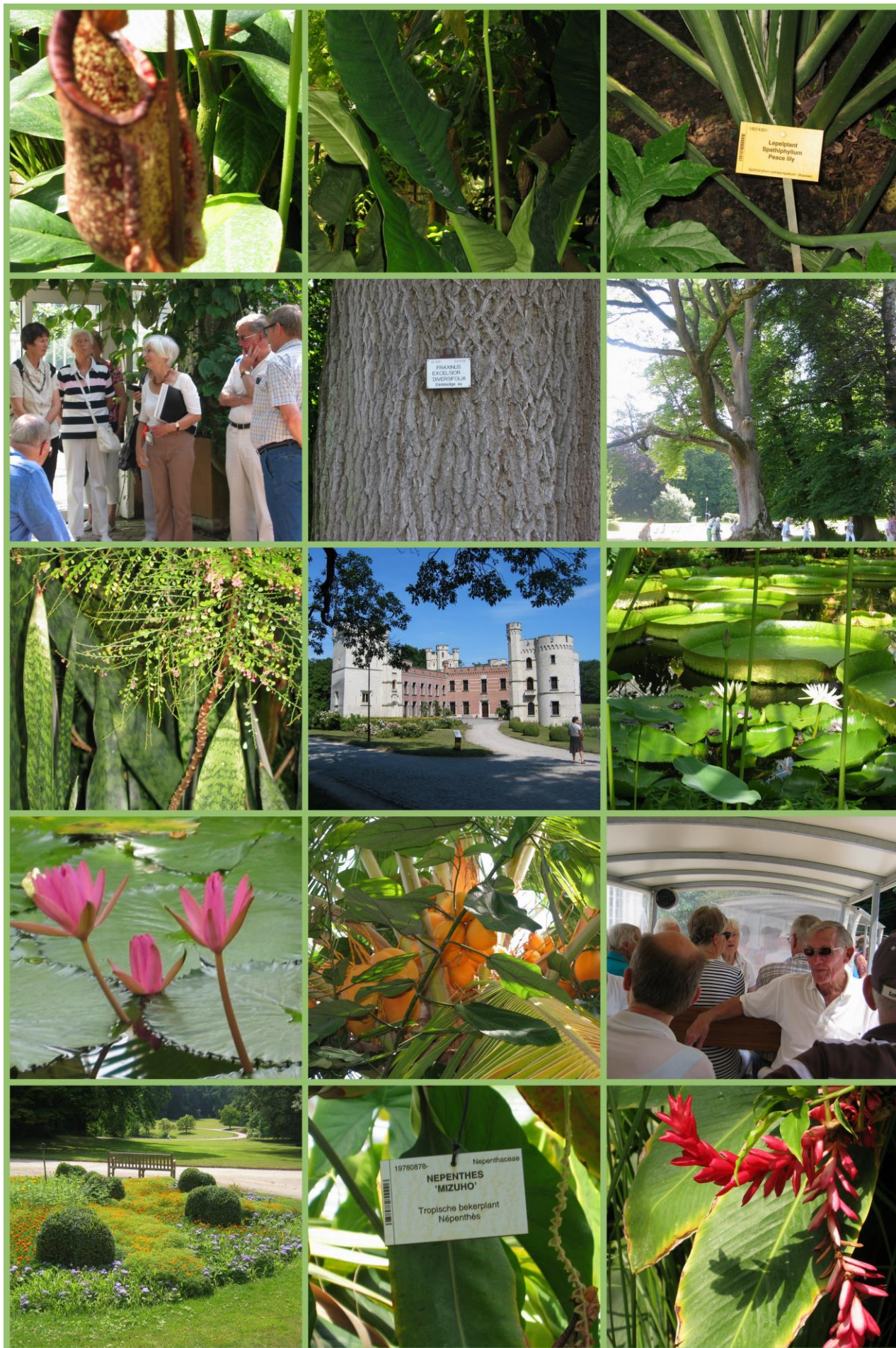
Fotocollage studiedag VAMP naar Plantentuin Meise (België)