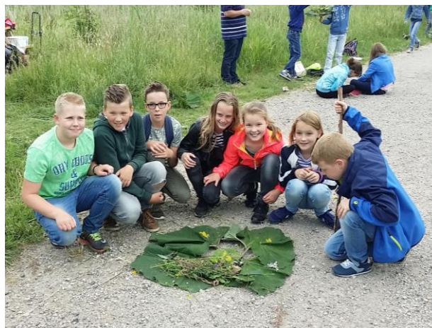
OBS De Tweestroom