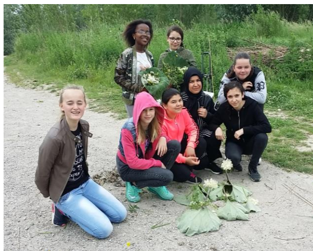
OBS De Dolfijn

Ze mochten zelf op zoek naar allerlei materialen in de vrije natuur. Daarna maakten ze er een natuur-kunstwerk van. Voor de Zwijndrechtse stadskinderen zijn deze excursies goud waard. Zo’n ochtend in de natuur levert ontdekkingen op die hun nog lang zullen bijblijven. Dank aan de schoolgidsen!