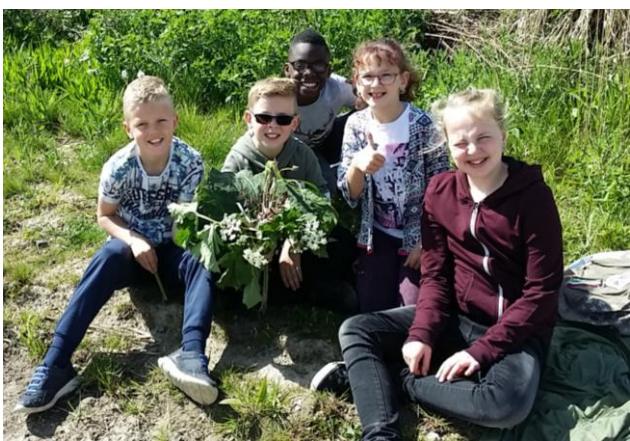
OBS De Kim

De oudere kinderen van CBS De Kim, OBS de Twee Wieken, OBS De Tweestroom en OBS De Dolfijn gingen lekker ‘Struinen op de Hooge Nesse’.