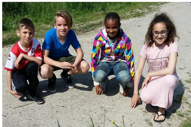
OBS De Twee Wieken