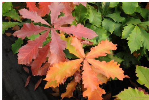
• Quercus bicolor

gevuld met nieuwe beplanting. Deze werkzaamheden worden te zwaar voor onze vrijwilligers en worden daarom door derden uitgevoerd. Hiervoor is geld nodig, véél geld. Wij rekenen daarom weer op de gemeente, die ons subsidie verleent.