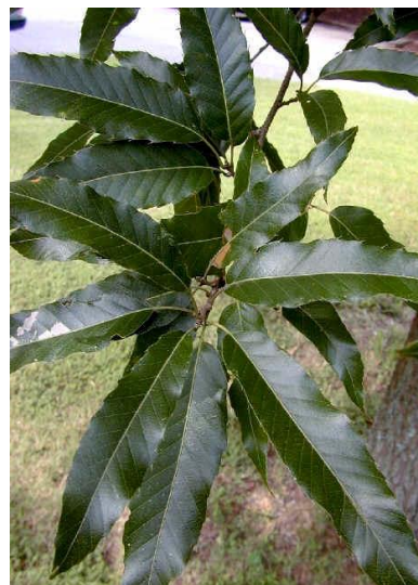
• Quercus acutissima

Er zijn 2 bomen door andere vervangen: de eik Quercus marilandica-Jack Black op het rozeneiland is vervangen door een Quercus bicolor (tweekleurige eik). De populier nr. 112 is vervangen door een Quercus acutissima (gezaagbladige eik). Deze boom lijkt, qua blad, veel op een Castanea sativa (tamme kastanje), daarom staat deze nu naast de kastanjes.