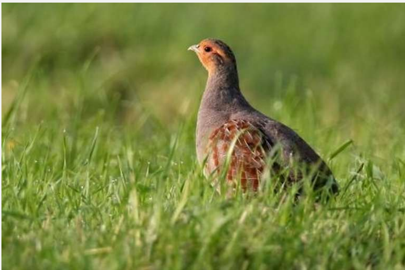
Patrijs

opmerkelijk, omdat men hiermee feitelijk afstand neemt van het gedachtengoed van partijgenoot Frans Timmermans, initiatiefnemer van de Europese Green Deal voor duurzaamheid.