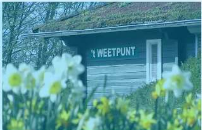
"De Zwijndrechtse Waard is een klein plekje op de landkaart, maar ook op dit kleine plekje zijn nog vele mooie stukjes groen te vinden".

Het gehele jaar door organiseert IVN natuuractiviteiten voor de jeugd. Een zaterdag- en/of een woensdagmiddag van de maand maken de kinderen met hun (groot) ouders op een ongezwongen manier kennis met de natuur in hun directe omgeving. Het programma is te vinden op de website: www.natuur-zw.nl .