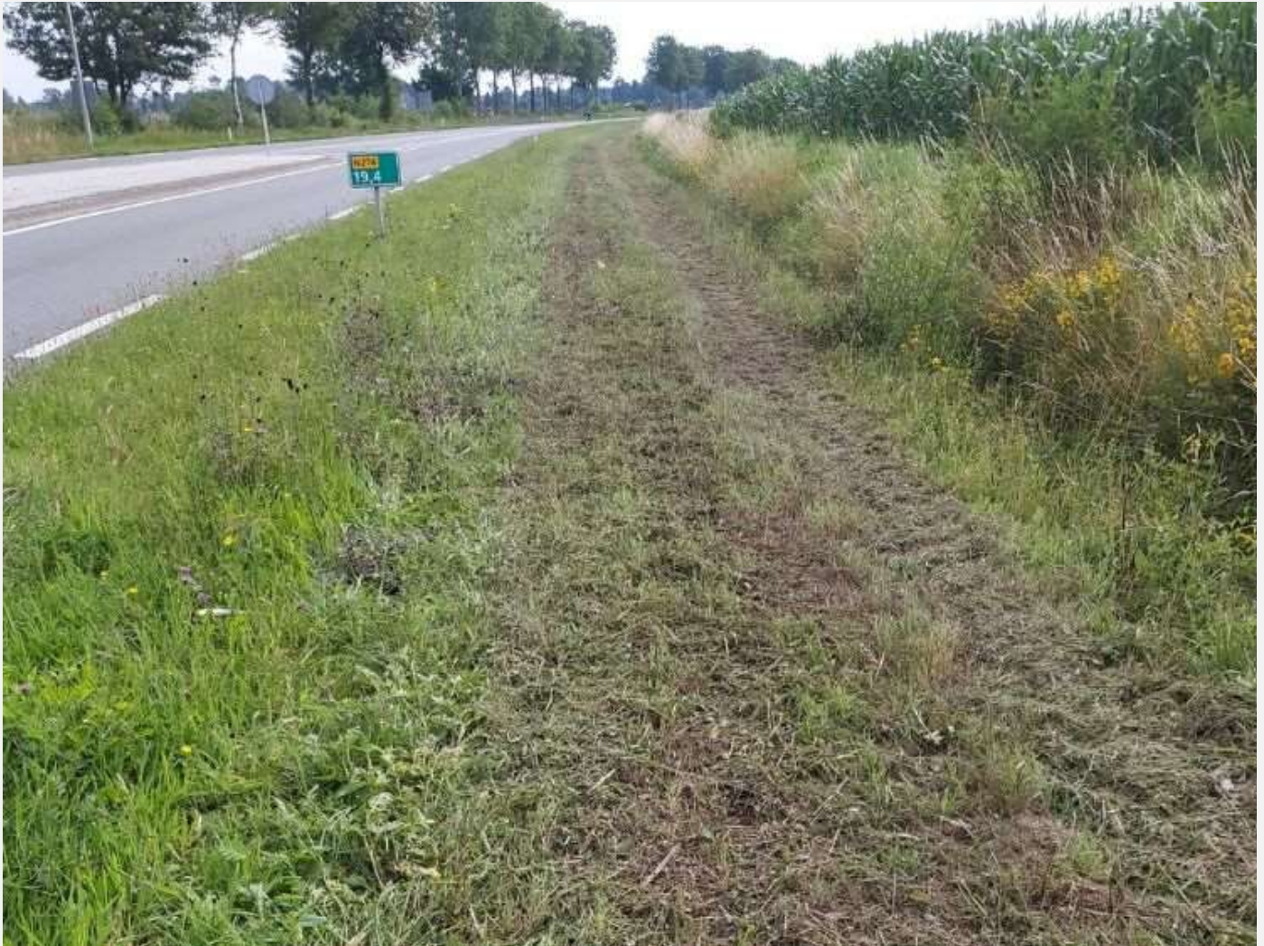
Kansen zeldzame vlinder gesmoord in berm Posterholt.